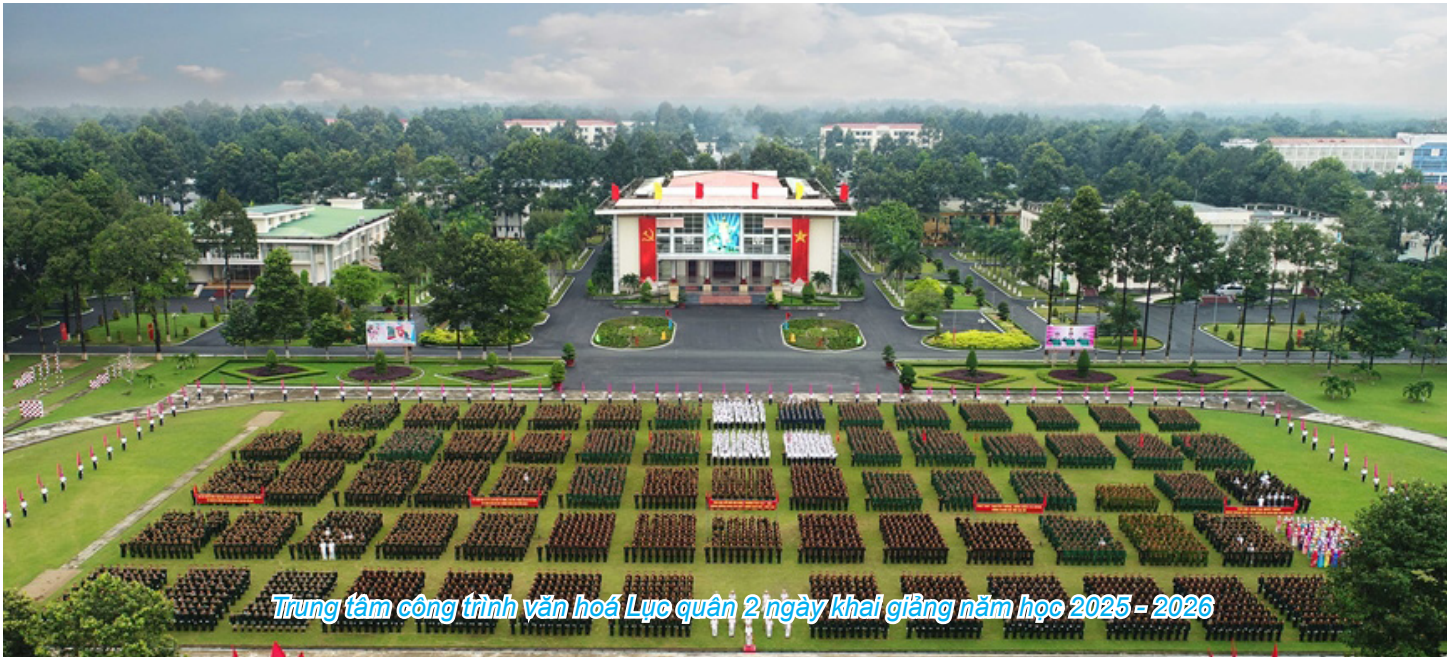
Trung tâm công trình văn hoá Lục quân 2 ngày khai giảng năm học 2025 - 2026