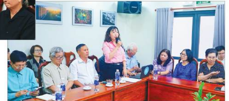
Hội viên Hồng Nhạn trình bày chuyên đề tại buổi gặp mặt