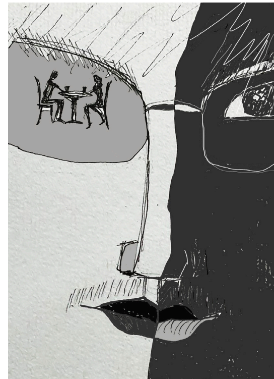
Minh họa: Phạm Công Hoàng

Đã ba tháng trôi qua, mẹ con Bảo vẫn chưa tìm được mối ưng ý. Có gia đình từ chối vì không hợp tuổi, có gia đình con gái sắp đi du học nên không có ý định lấy