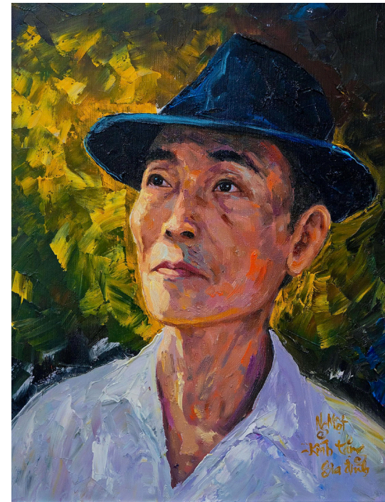
Bức họa NV Hoàng Văn Bổn - Nguyễn Một

Có những người viết về chiến tranh như một ký ức, có những người viết bằng sự quan sát; ông viết từ bên trong, nơi mà ranh giới giữa sống và chết không rõ ràng, nơi mỗi ngày đều có thể là ngày cuối cùng.