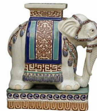
Đôn voi gốm tại Công ty Gốm Biên Hòa

Trong cấu trúc tổng thể của đôn voi gốm, mặt đôn là bộ phận gắn trực tiếp với công năng sử dụng, đồng thời là không gian để người thợ gốm triển khai các đồ án trang trí. Về phương diện tạo hình, mặt đôn là sự cách điệu của bành voi (chiếc ghế đặt trên lưng voi trong truyền thống). Vì vậy, mặt đôn không chỉ đơn thuần là một mặt phẳng mang tính chức năng mà còn là nơi hàm chứa những ước vọng, quan niệm thẩm mỹ và ý nghĩa biểu trưng của người tạo tác cũng như người sử dụng. Xét dưới góc độ cấu trúc, mặt đôn bao gồm mặt bằng và các mặt đứng bao quanh. Mặt bằng là phần tiếp xúc trực tiếp với vật được đặt lên, đồng thời là trung