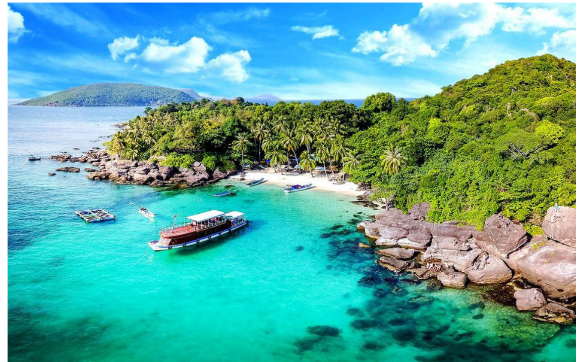
Một điểm du lịch ở Côn Đảo

21 giờ, tôi cùng anh em trong đoàn sửa soạn đồ lễ đi viếng nghĩa trang Hàng Dương và mộ phần Anh hùng liệt sĩ Võ Thị Sáu. Do được hướng dẫn từ trước nên mọi lễ vật chúng tôi đều chuẩn bị từ Thành phố Hồ Chí Minh mang ra. Lễ viếng “cô Sáu” có hoa trắng, nón trắng, áo dài trắng, nước trắng, trái cây, gương lược... những lễ vật rất đời thường và trên đảo cũng có khá nhiều nơi nhận sắp lễ để viếng “cô Sáu” dành cho du khách.