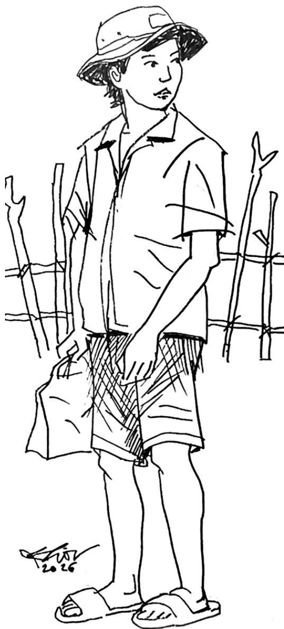
Minh họa: Ngô Xuân Khôi