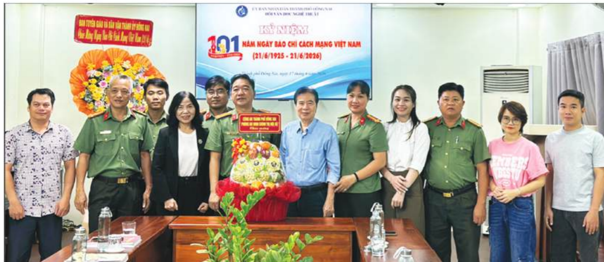
Đoàn công tác Phòng Chính trị PA03 Công an Đồng Nai đến thăm và chúc mừng Tạp chí Văn nghệ Đồng Nai