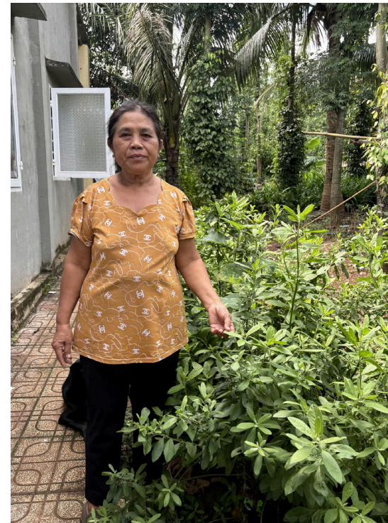
Phụ nữ Chơ Ro bên cây ngải từ bi (cúc tần) trị viêm họng

cao nhất. Hiện nay, loài cây này cũng đang thu hút sự quan tâm của giới nghiên cứu về khả năng tăng cường sức đề kháng và hỗ trợ điều trị một số bệnh lý. Trị đau bao tử: dùng mật ong ruồi (sứt lờ oay) đem trộn vớt bột nghệ (sơ cà mít) dùng khi bụng đói, hiệu quả nhất là ăn trước lúc ăn sáng; dùng liên tục trong một tháng bệnh đau bao tử sẽ được suy giảm. Bên cạnh các loài thực vật, một số sản phẩm từ tự nhiên như mật ong rừng và rượu cần đặc trưng cũng được xem là những “dược liệu” trong đời sống. Mật ong được sử dụng để bồi bổ cơ thể, hỗ trợ tiêu hóa; trong khi rượu cần với men được chế biến từ các loại rễ, vỏ và lá cây không chỉ là thức uống truyền thống mà còn có giá trị hỗ trợ sức khỏe khi sử dụng ở mức độ hợp lý.