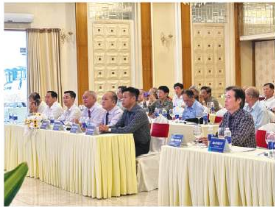
Lãnh đạo và hội viên Hội VHNT Đồng Nai tham dự Hội nghị