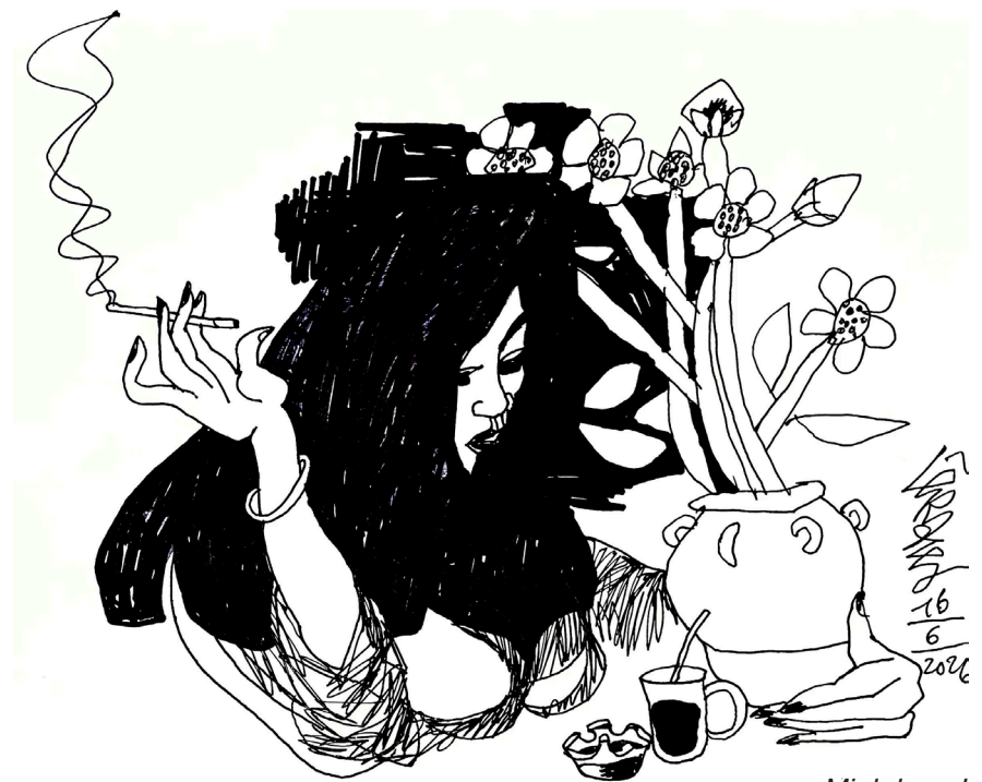
Minh họa: Lê Trí Dũng

“Tôi cũng không biết nữa. Đạo này tôi hay khó chịu khi ở nhà. Bởi vậy tôi chưa muốn về nhà”.