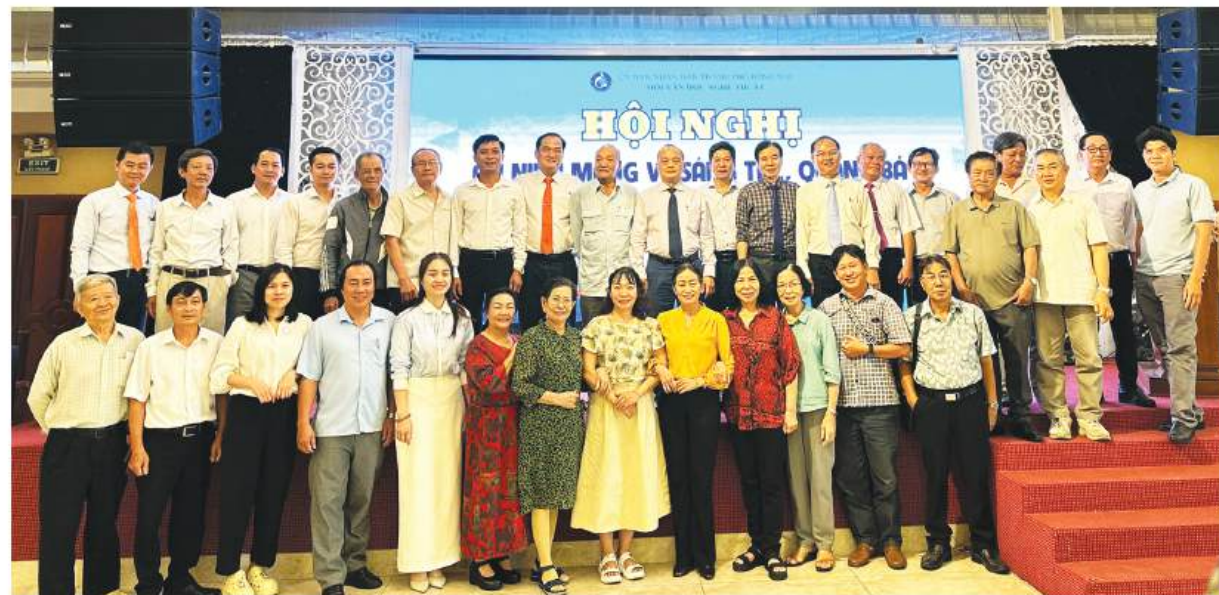
Báo cáo viên chụp hình lưu niệm cùng lãnh đạo và hội viên Hội VHNT Đồng Nai